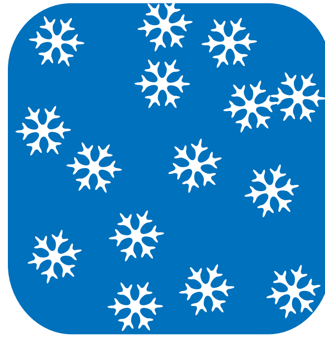
A VECES ACOMPAÑADO DE NIEVE E INUNDACIONES