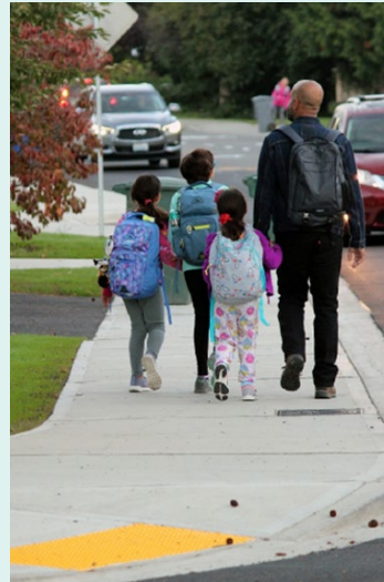
歩道と多目的通行帯

安全システム行動には、歩行者、二輪車、自転車、自動車のさまざまな安全措置が含まれています。