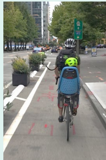
保護された自転車専用レーンと路肩走行帯