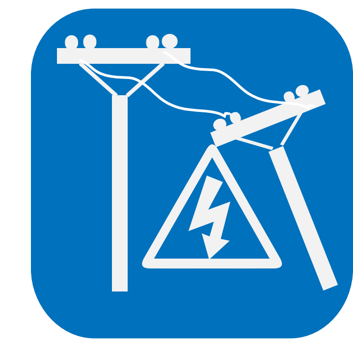
МОЖЕТ ПРИВЕСТИ К ПЕРЕБОЯМ В ПОДАЧЕ ЭЛЕКТРОЭНЕРГИИ