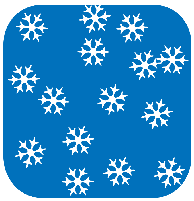
ИНОГДА МОЖЕТ СОПРОВОЖДАТЬСЯ СНЕГОМ И НАВОДНЕНИЕМ