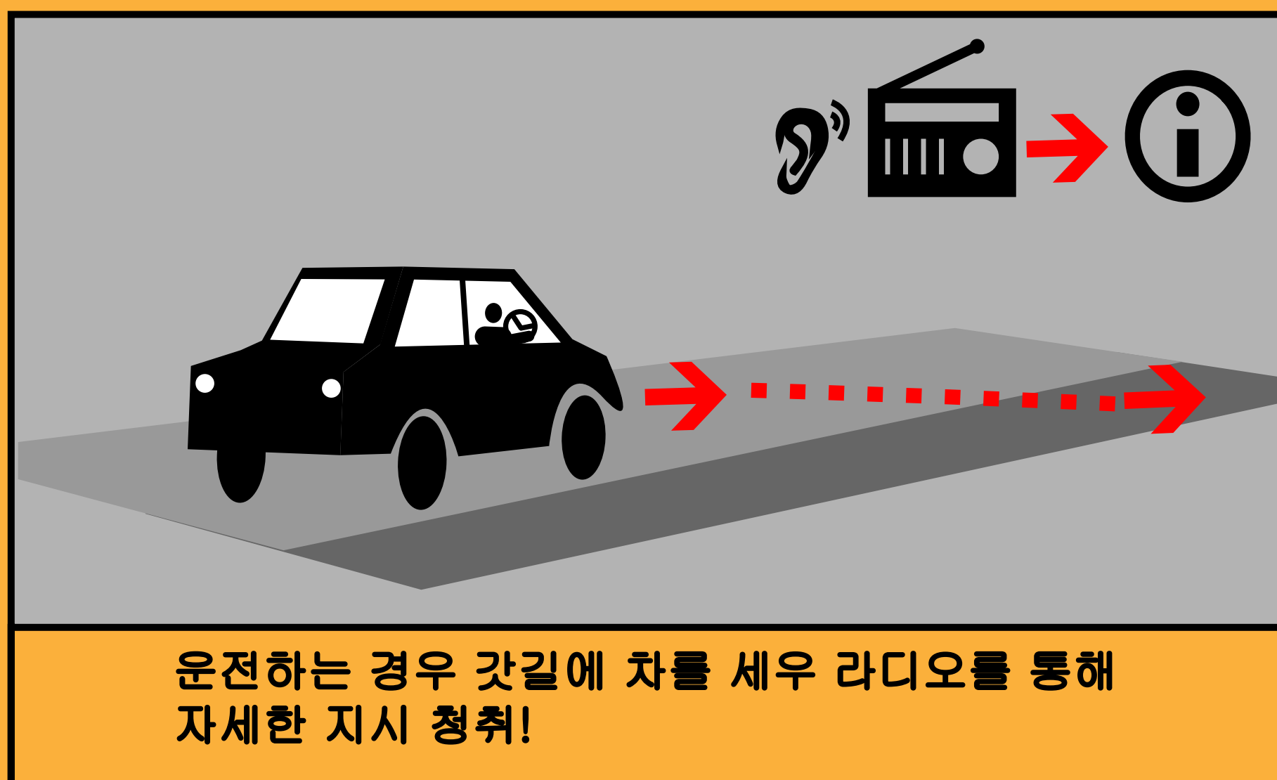
운전하는 경우 갓길에 차를 세우 라디오를 통해 자세한 지시 청취!