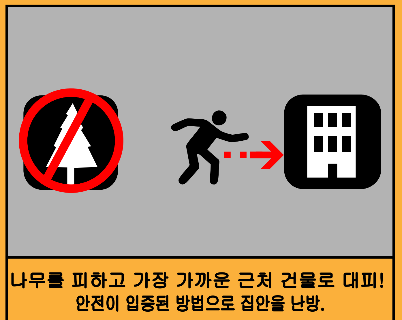
나무를 피하고 가장 가까운 근처 건물로 대피! 안전이 입증된 방법으로 집안을 난방.