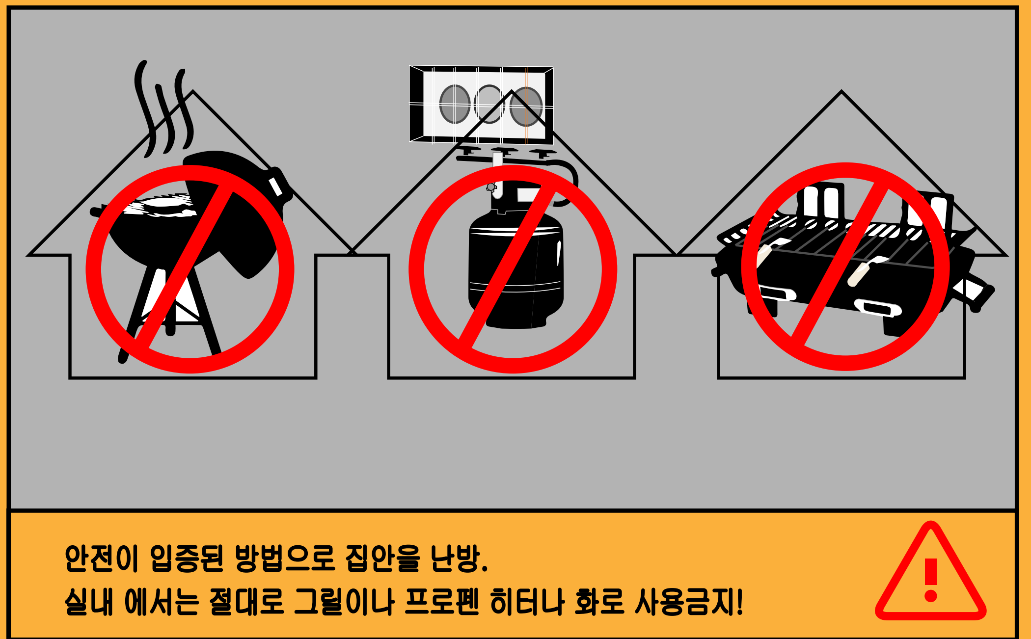
안전이 입증된 방법으로 집안을 난방. 실내에서는 절대로 그릴이나 프로펜 히터나 화로 사용금지!