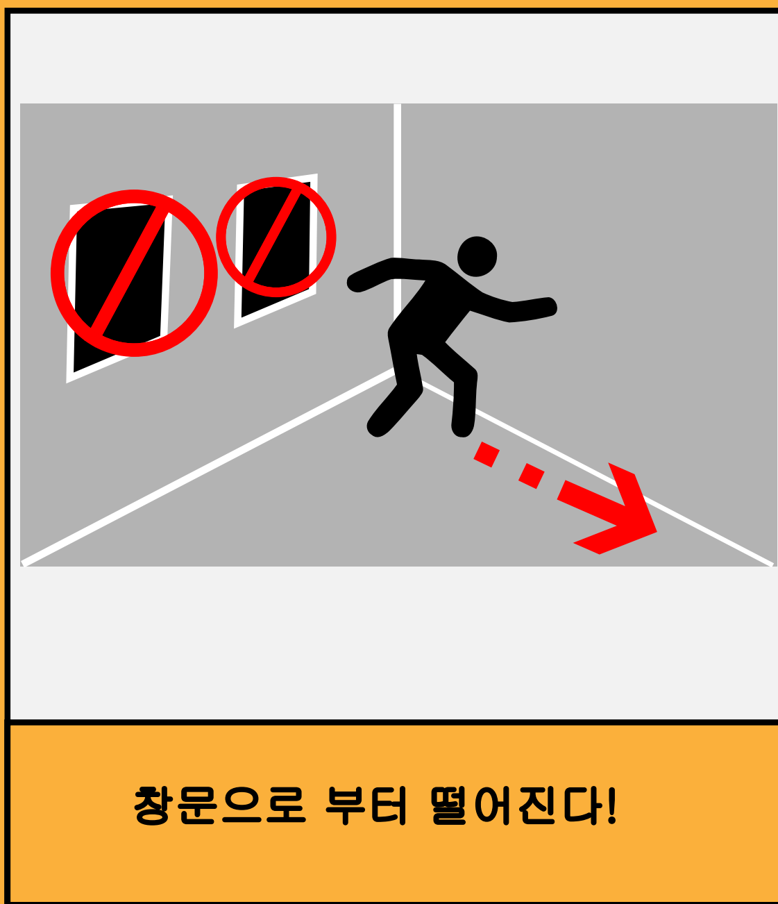
창문으로 부터 떨어진다!